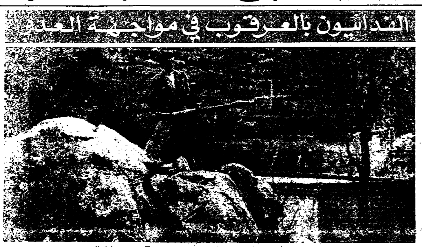
انسان من الداعيين في مواجهة القوات العدو في مناطق الحروب امس